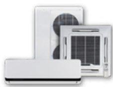
Ar condicionado Aquecimento piscina