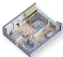
3D de arquitectura