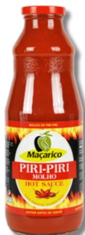
MOLHO PIRI-PIRI MACARICO 1,130KG