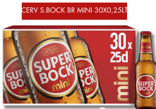
CERV S. BOCK BR MINI 30X0,25LT