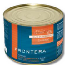
ATUM FRONTERA POSTA 1,730KG