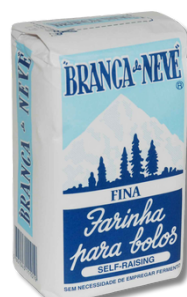
FARIN BRANCA NEVE FINA CF 1KG