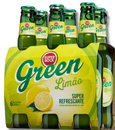
CERV S. BOCK GREEN 0,33LT T.P