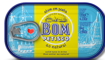
ATUM B. PETISCO NATURAL 120G