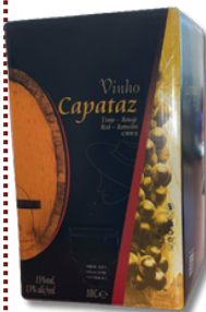
VIN CAPATAZ TINTO BOX 10LT