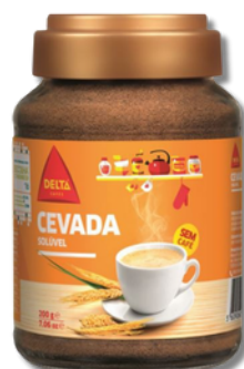
CEVADA DELTA SOLUVEL 200GR