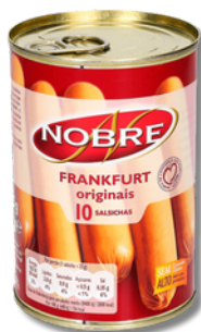
SALSI NOBRE LAT 10 UNID 250GR