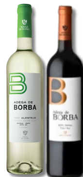
VIN BORBA DOC BRANCO VIN BORBA DOC TINTO