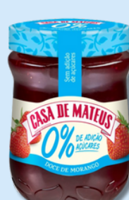
DOCE MATEUS 4FRUTOS, ABÓBORA, CEREJA, MIRTILO, MORANGO, PESEGO 0% 280G