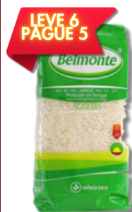
ARROZ AGULHA BELMONTE 1KG