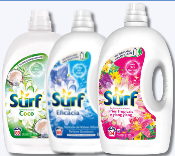
DET SURF LIQ COCO 84D DET SURF LIQ EXT/EFICACIA 84D DET SURF LIQ TROPICAL 84D