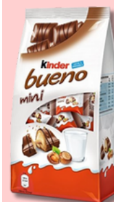
KINDER BUENO MINI T20 108G