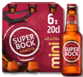
CERV S. BOCK ABADIA MINI 0,20LT