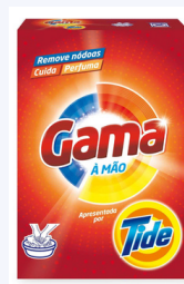
1CX DET GAMA MANUAL E/3 510GR C/12