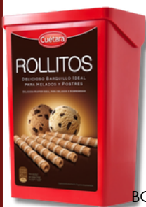
BOL CUETARA ROLLITOS 225G