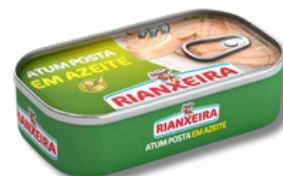
ATUM RIANXEI AZEITE 120GR