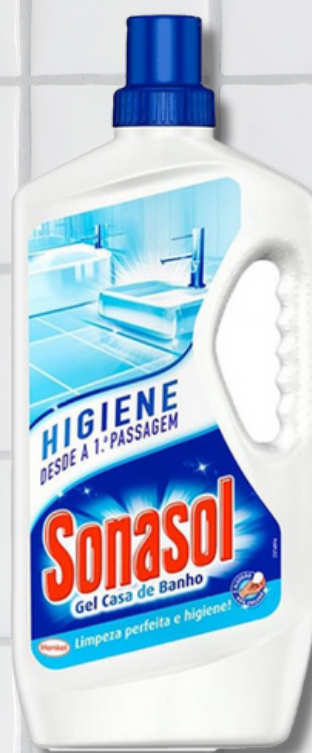
DET SONASOL CASA BANHO 600ML