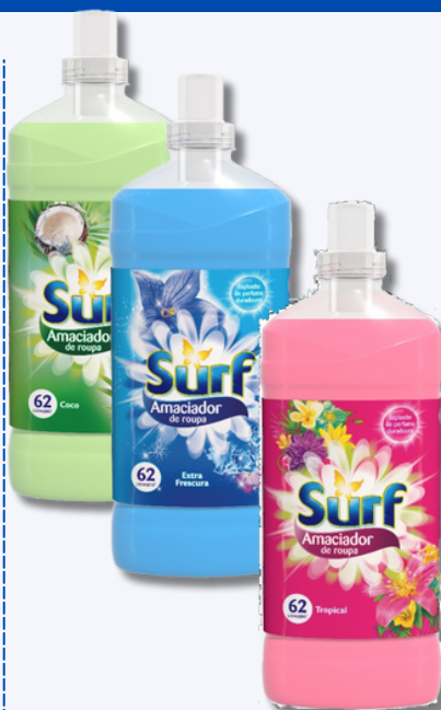
AMACI SURF COCO, EXTRA FRESCURA, TROPICAL 62D