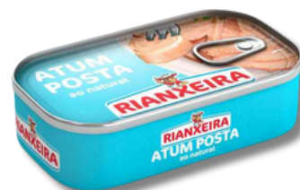
ATUM RIANXEI NATURAL 120GR