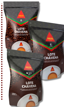
CAFE DELTA GRAO 250G CAFE DELTA MOIDO MAQUINA 250G CAFE DELTA MOIDO SACO 250G