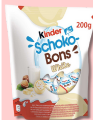
KINDER SHOKOBONS BRANCO 200G