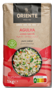
ARROZ AGULHA ORIENTE 1KG (x12)