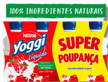
IOG LV YOGGI 8X160G