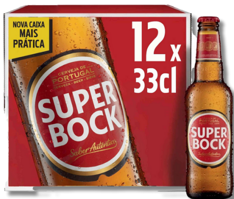
CERV S. BOCK 12X0,33LT TP