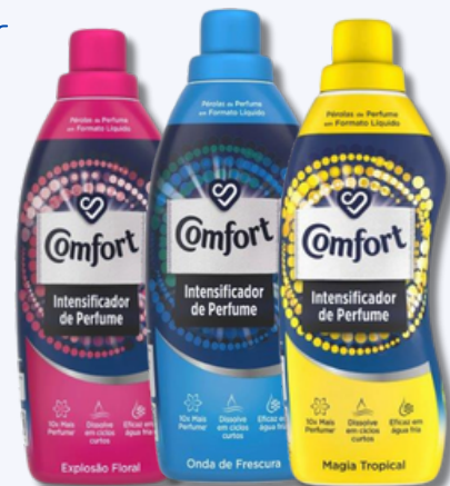
PERFUMADOR ROUPA COMFORT 760ML

NA COMPRA DE 1 UNI DET A+ LIQ OPTIMAL 85D