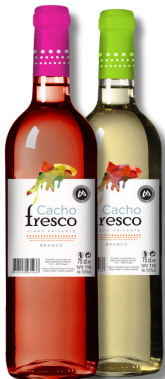
VIN CACHO FRESCO FRIZ BR 0,75 VIN CACHO FRESCO FRIZ RO 0,75