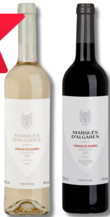
VIN MARQUES ALGARES BRANCO 0,75LT VIN MARQUES ALGARES TINTO 0,75LT