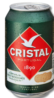
CERV CRISTAL LATA 0,33LT