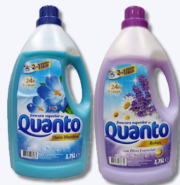
AMACI QUANTO F/SILV 3,75ML AMACI QUANTO RELAX 3,75ML

NA COMPRA DE 1 UNI DET A+ LIQ ESSENCIA PROVENCA 65D