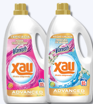
DET XAU LIQ+VANISH 85D DET XAU LIQ+VANISH JASMIM 85D