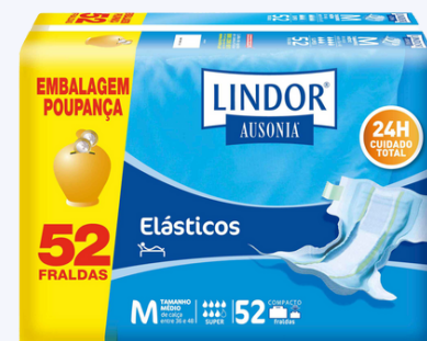
FRA LINDOR ACAMADO GRANDE 46 FRA LINDOR ACAMADO MEDIA 52