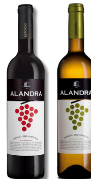
VIN ALANDRA TINTO VIN ALANDRA BRANCO

Preços válidos de 08 a 13 Abril de 2024 em Cash. Salvo erro tipográfico, de fotografia ou de rutura de stocks. Preços Cash sem IVA. Ações promocionais não acumuláveis com outras ofertas em loja.