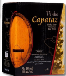
VIN CAPATAZ BRAN BOX 5LT VIN CAPATAZ TINTO BOX 5LT