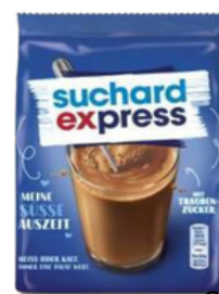
CHOCOLATE PO SUCHARD EXPRESS 500