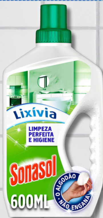
DET SONASOL GEL LIX 600ML