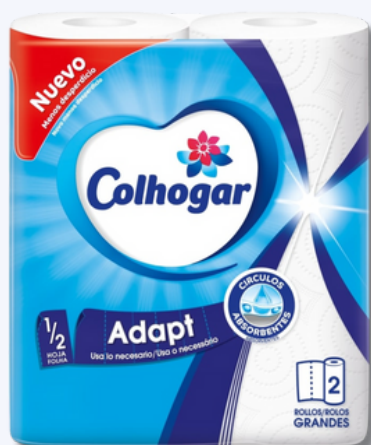
ROLO COZ COLHOGAR ADAPT BR 2=3R