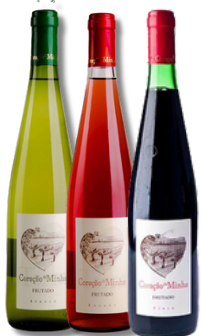
VIN CORACAO MINHA BRAN 0,75LT VIN CORACAO MINHA ROSE 0,75LT VIN CORACAO MINHA T/T 0,75LT