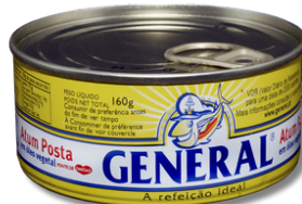
ATUM GENERAL POSTA OLEO 160G