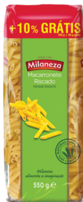
MASSA MILANEZA RISCADA 500G+10%