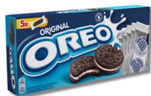
BOL OREO 220G