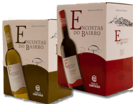
VIN ENCOSTAS BAIRRO BRAN BOX 5LT VIN ENCOSTAS BAIRRO T/T BOX 5LT