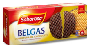
BOL SABOROSA BELGA CHOCOLAT 198G