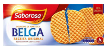
BOL SABOROSA BELGA CASEIRO 220G