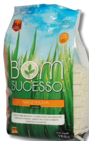
ARROZ AGULHA BOM SUCESSO 1KG