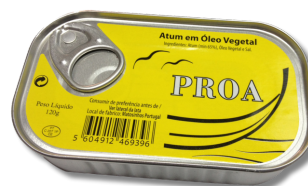
ATUM PROA OLEO 120GR