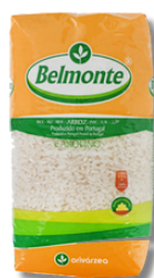
ARROZ LONGO BELMONTE 1KG