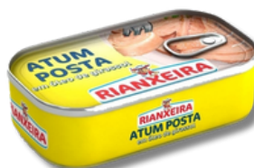
ATUM RIANXEI POSTA 120GR