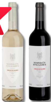
VIN MARQUES ALGARES BRANCO 0,75LT VIN MARQUES ALGARES TINTO 0,75LT