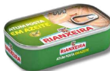
ATUM RIANXEI AZEITE 120GR