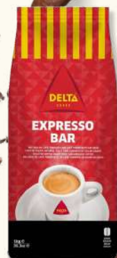
CAFE DELTA EXPRESSO GRAO KG