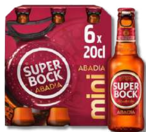
CERV S. BOCK ABADIA MINI 0,20LT