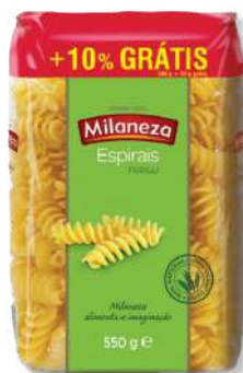
MASSA MILANEZA ESPIRAIS 500G+10%