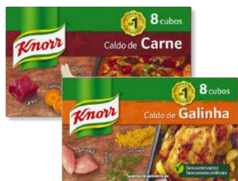
KNORR CARNE FAMILI 8CUB KNORR GALIN FAMILI 8CUB