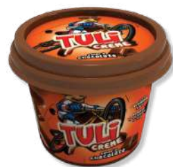
CREME BARRAR TULICREME CHOC 200G