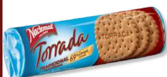
BOL NACIONAL TORRADA 200G