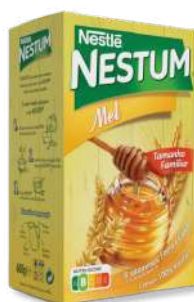
CEREAIS NESTUM MEL CL 600G