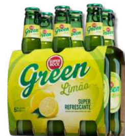
CERV S. BOCK GREEN 0,33LT T.P