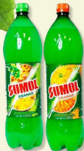
REFRI SUMOL ANANAS 1,5L

Preços válidos de 15 a 20 Abril de 2024 em Cash. Salvo erro tipográfico, de fotografia ou de rotunda de stocks. Preço Cash sem IVA. Ações promocionais não acumuláveis com outras ofertas em loja.