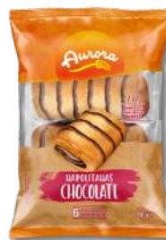
BOLO AURORA NAPOLIT CHOC 240G