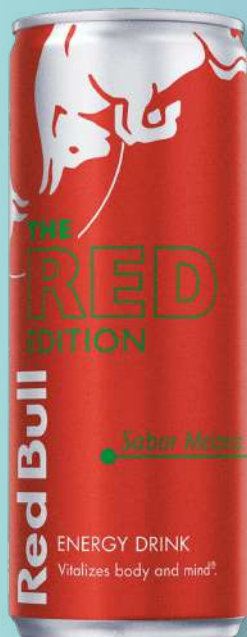
ENERG RED BULL RED EDIT 250ML