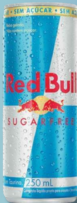
ENERG RED BULL SUG FREE 250ML