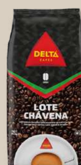
CAFE DELTA CHAV GRAO C/TE KG CAFE DELTA CHAV GRAO S/TE KG

Preços válidos de 15 a 20 Abril de 2024 em Cash. Salvo erro tipográfico, de fotografia ou de rutura de stocks. Preços Cash sem IVA. Ações promocionais não acumuláveis com outras ofertas em loja.