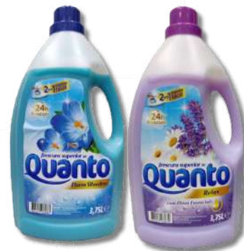
AMACI QUANTO F/SILV 3,75ML AMACI QUANTO RELAX 3,75ML

NA COMPRA DE 1 UNI DET A+ LIQ ESSENCIA PROVENÇA 65D