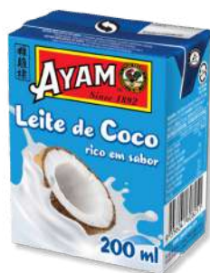
LEITE COCO AYAM 200ML