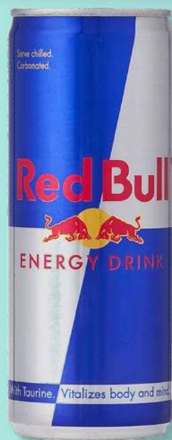
ENERG RED BULL 250ML