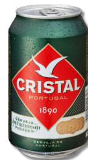
CERV CRISTAL LATA 0,33LT