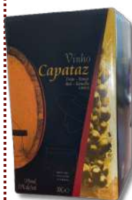
VIN CAPATAZ TINTO BOX 10LT