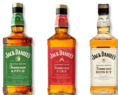
WHISKY J DANIELS APPLE 40% 0,70L WHISKY J DANIELS TENESSEE FIRE 4 SPIRIT JACK DANIELS HONEY 0,70L