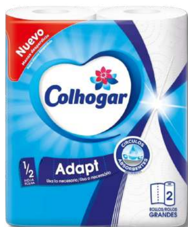
ROLO COZ COLHOGAR ADAPT BR 2=3R