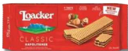
BOL LOACKER KAKAO 175GR BOL LOACKER QUADRAT NAPOLITANER