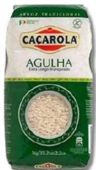
ARROZ AGULHA CACAROLA 1KG