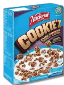
CEREAIS NACIONAL COOKIEZ 300G