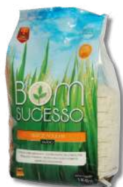
ARROZ AGULHA BOM SUCESSO 1KG