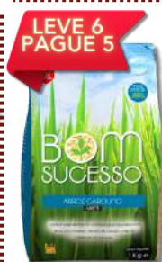
ARROZ LONGO BOM SUCESSO 1KG