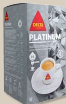
CAFE DELTA PASTI LIGHTS 16X7G CAFE DELTA PASTI PLATINA 16X7G