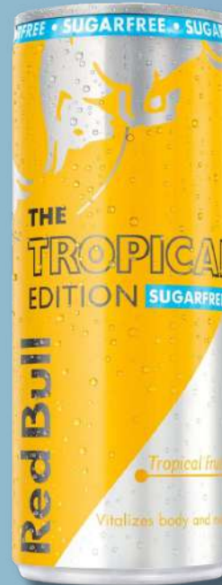
ENERG RED BULL TRO EDIT 250ML