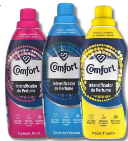
PERFUMADOR ROUPA COMFORT 760ML

NA COMPRA DE 1 UNI DET A+ LIQ OPTIMAL 85D