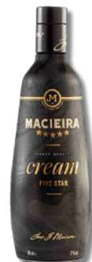
LICOR MACIEIRA CREAM 17% 0,70L