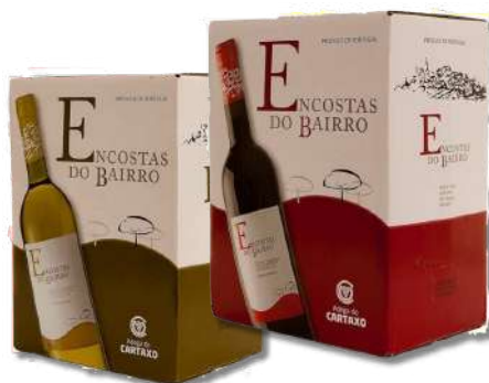
VIN ENCOSTAS BAIRRO BRAN BOX 5LT VIN ENCOSTAS BAIRRO T/T BOX 5LT