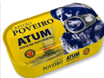
ATUM C. POVEIRO OLEO 110GR