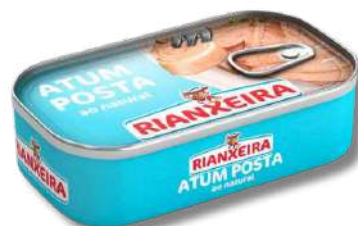
ATUM RIANXEI NATURAL 120GR