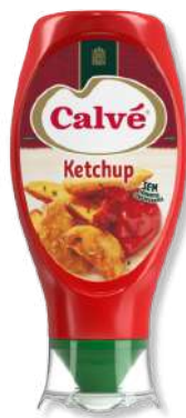
KETCHUP CALVE TOP DOWN 275GR