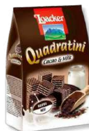
BOL LOACKER QUADRAT CHOCOLATE 25