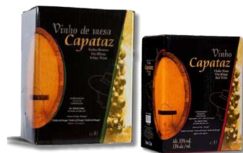
VIN CAPATAZ BRAN BOX 5LT VIN CAPATAZ TINTO BOX 5LT