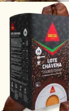
CAFE DELTA PASTI CHAVENA 16X7G