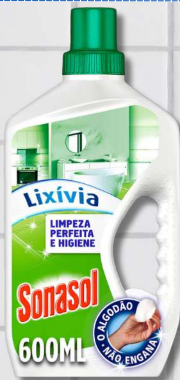
DET SONASOL GEL LIX 600ML