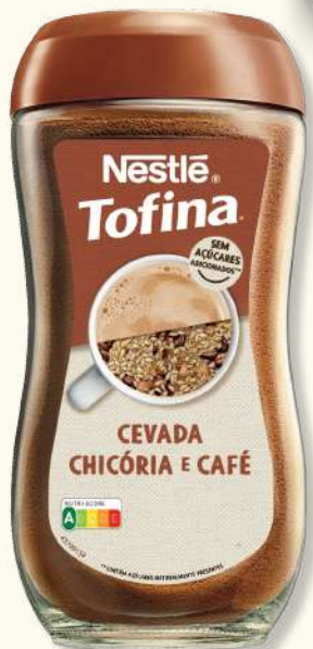
CAFE TOFINA MISTURA 200GR