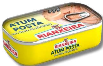
ATUM RIANXEI POSTA 120GR