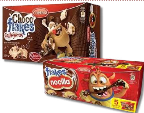
BOL CUETARA CHOCO FLAKES 250G BOL CUETARA FLAKES NOCILLA 175G