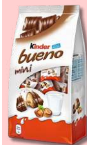
KINDER BUENO MINI T20 108G