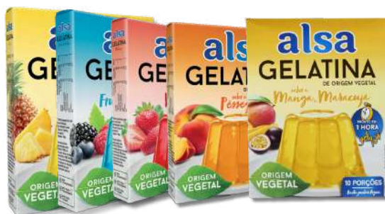
GELATI ALSA GELLY JA ANANAS, FR BOSQUE, MANG/MARAC, MORANGO, PESEGO 105G