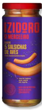
SALSI IZI VITA AVES FR 5U