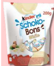
KINDER SHOKOBONS BRANCO 200G