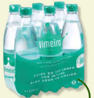
AGUA VIMEIRO GAS 0,5L TP