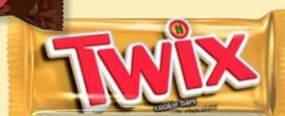
CHOCOL MARS 50GR CHOCOL SNICKERS 50GR CHOCOL TWIX 50GR

Preços válidos de 15 a 20 Abril de 2024 em Cash. Salvo erro tipográfico, de fotografia ou de rutura de stocks. Preços Cash sem IVA. Ações promocionais não acumuláveis com outras ofertas em loja.