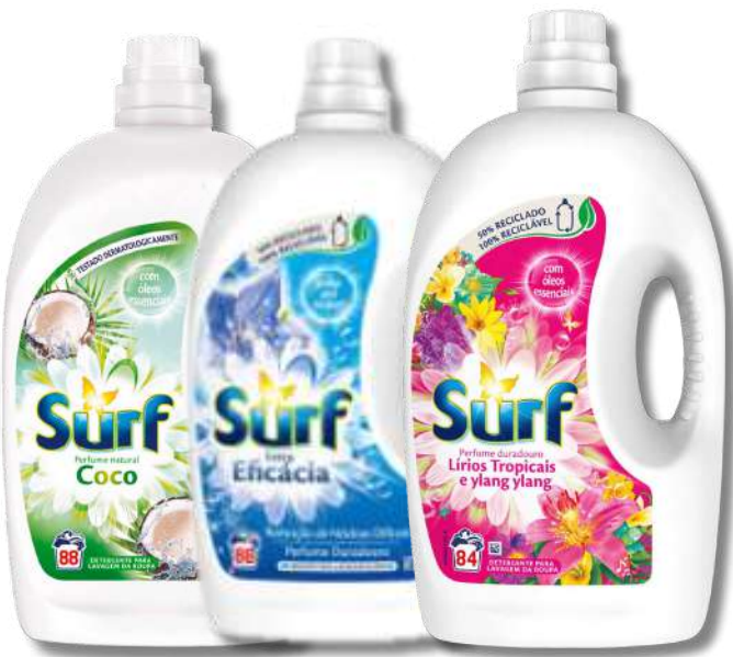
DET SURF LIQ COCO 84D DET SURF LIQ EXT/EFICÁCIA 84D DET SURF LIQ TROPICAL 84D