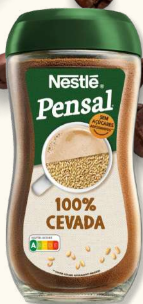
CEVADA PENSAL 200G