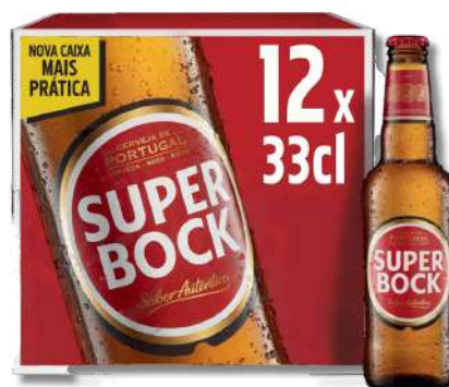
CERV S. BOCK 12X0,33LT TP

Preços válidos de 15 a 20 Abril de 2024 em Cash. Salvo erro tipográfico, de fotografia ou de rotura de stocks. Preços Cash sem IVA. Ações promocionais não acumuláveis com outras ofertas em loja.