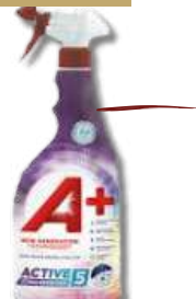
1UND DET A+ TIRA NODOAS 750ML

NA COMPRA 12UND SORTIDAS DET GAMA LIQ UNIVERSAL 90D DET GAMA LIQ FLORAL 90D