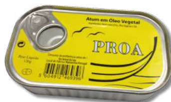
ATUM PROA OLEO 120GR