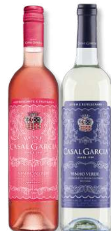
VIN CASAL GARCIA BRANCO VIN CASAL GARCIA ROSE