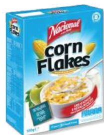
CEREAIS NACIONAL CFLAKES 500G