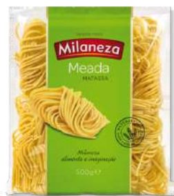
MASSA MILANEZA MEADA 500GR