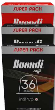
CAFE NESPRESSO BUONDI ORIG, INT, EXT 36CAP