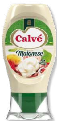
MAIONESE CALVE TD 240G