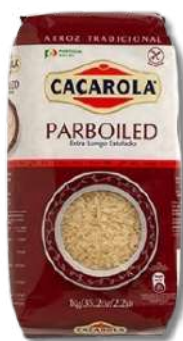
ARROZ AGU ESTUF CACAROLA 1KG

Preços válidos de 15 a 20 Abril de 2024 em Cash. Salvo erro tipográfico, de fotografia ou de rutura de stocks. Preços Cash sem IVA. Ações promocionais não acumuláveis com outras ofertas em loja.