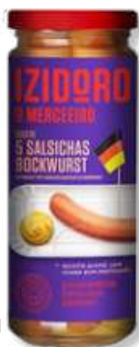
SALSI IZIDORO FRASCO 5 UN 245GR