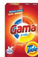
1CX DET GAMA MANUAL E/3 510GR C/12