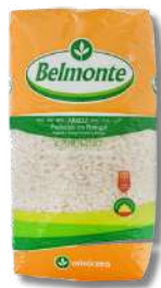
ARROZ LONGO BELMONTE 1KG