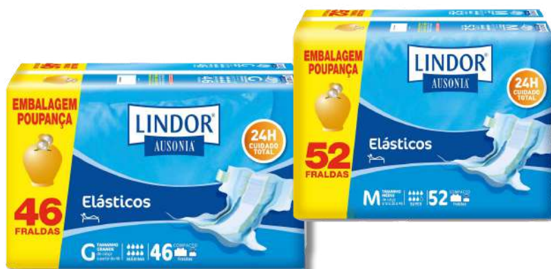
FRA LINDOR ACAMADO GRANDE 46 FRA LINDOR ACAMADO MEDIA 52