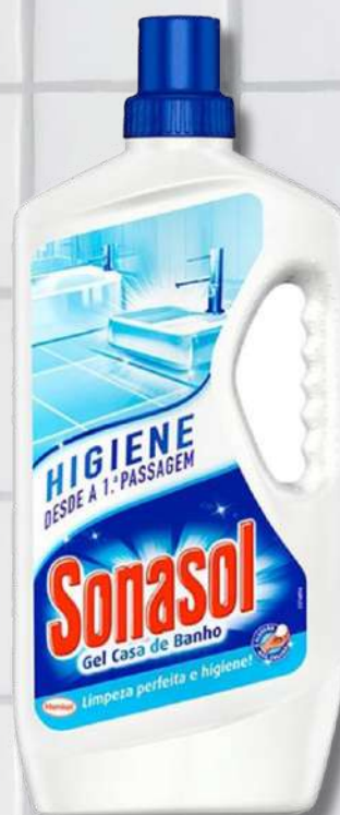
DET SONASOL CASA BANHO 600ML