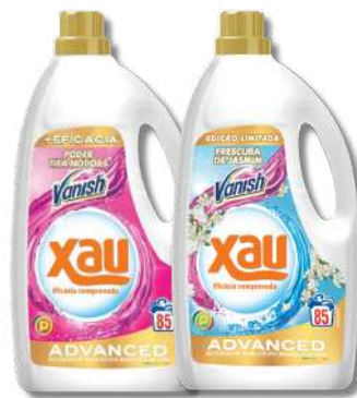
DET XAU LIQ+VANISH 85D DET XAU LIQ+VANISH JASMIM 85D