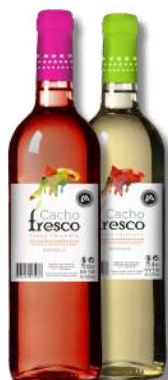
VIN CACHO FRESCO FRIZ BR 0,75 VIN CACHO FRESCO FRIZ RO 0,75