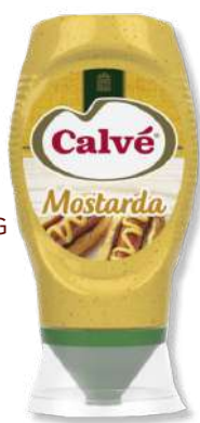
MOSTARDA CALVE T DOWN 257GR