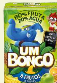
SUMO BONGO 8 FRUTOS 200ML