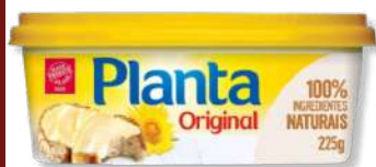
MARGARI PLANTA 225GR