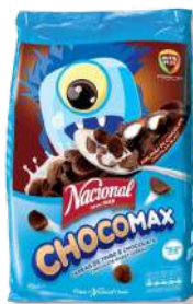
CEREAIS NACIONAL CHOCOMAX KG