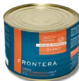
ATUM FRONTERA POSTA 1,730KG