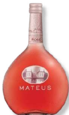
VIN MATEUS ROSE