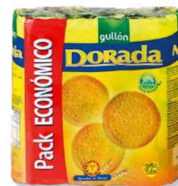
BOL GULLON MARIA DORADA 600G