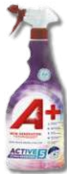
1UND DET A+ TIRA NODOAS 750ML