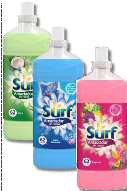
AMACI SURF COCO, EXTRA FRESCURA, TROPICAL 62D