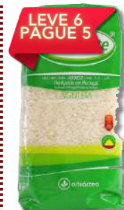
ARROZ AGULHA BELMONTE 1KG