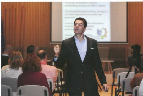
Palestra Professor Doutor Hipólito de Aguiar – As Farmácias face à concorrência – Que factores críticos?